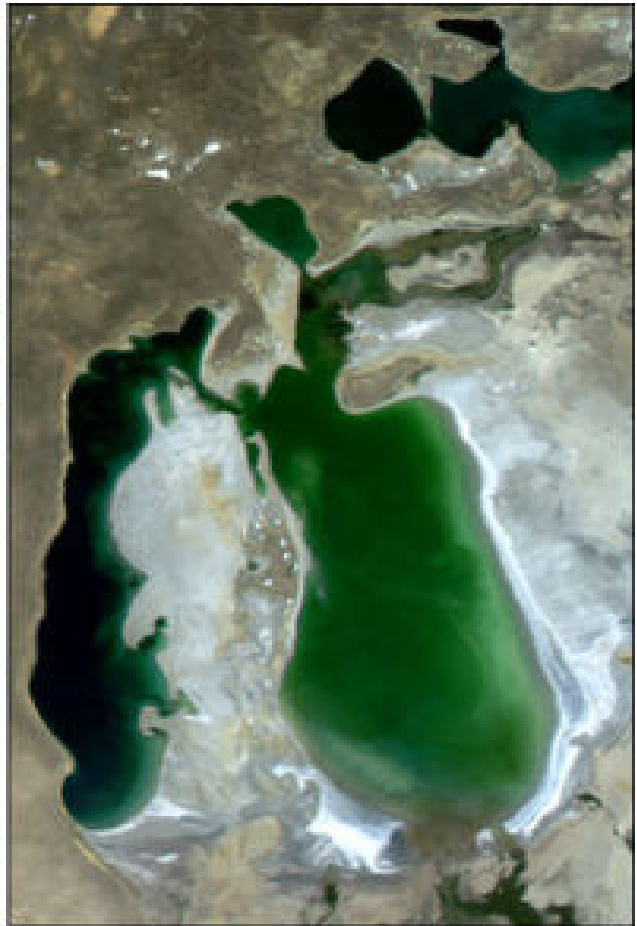
August 12, 2003