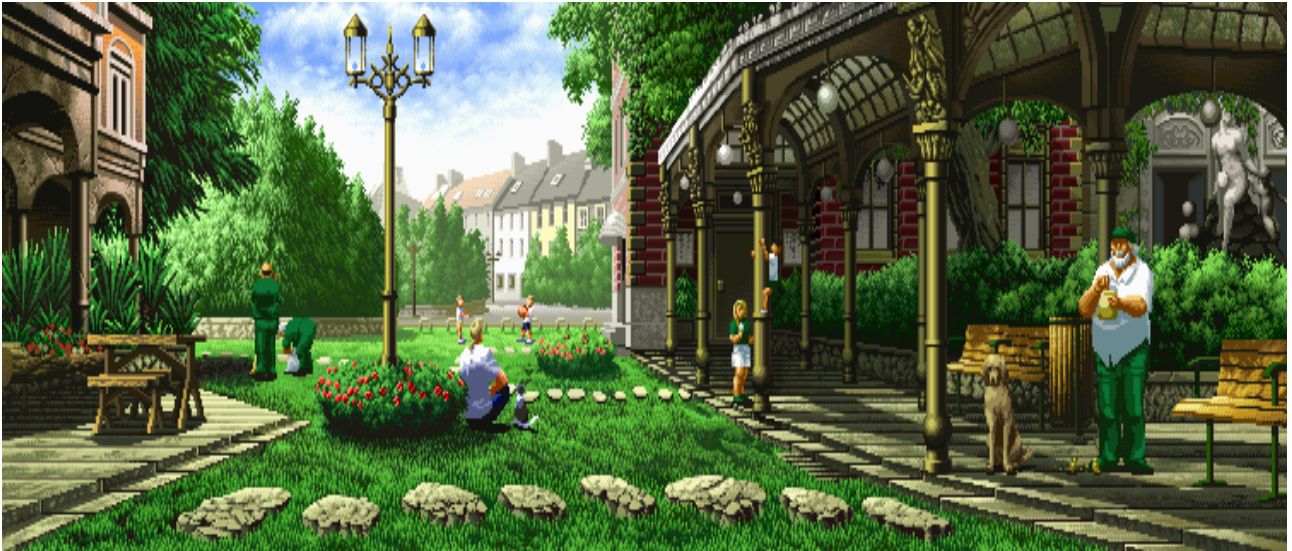
jardins bem irrigados

Em Detroit, Michigan, há três anos, 42 mil famílias ficaram sem água porque não podiam pagar suas contas de água. Então não acontece só nos países do chamado Terceiro Mundo, vamos ver essas desigualdades em todo o planeta.