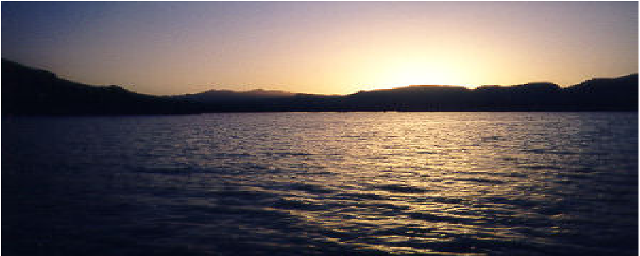
Por do sol - Lago Mead