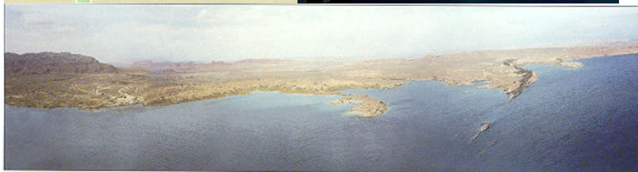
26 This composite photo shows the western shoreline of the Overton Arm north of Echo Bay Marina. Included are Stewarts Pt., Black Ridge Isl., & Fire Bay.