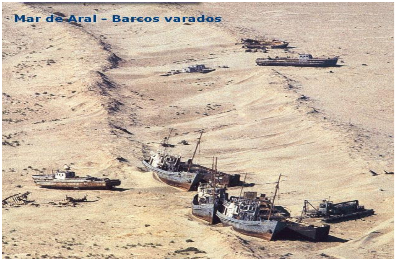
Mar de Aral