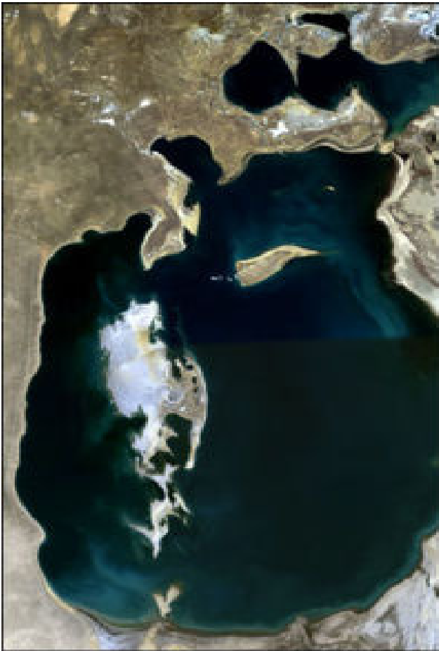
July - September, 1989