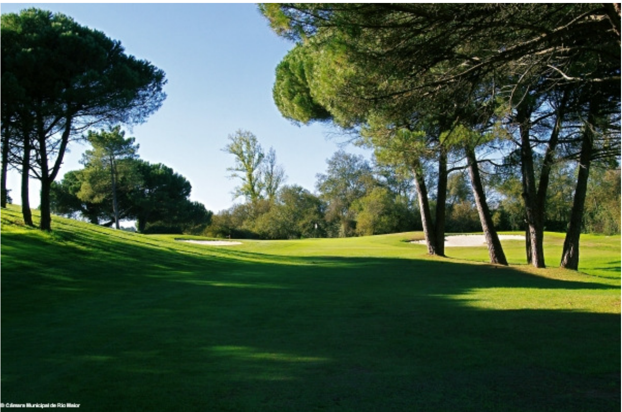
Campo de golfe

E, à medida que o preço começa a subir, haverá enormes diferenças entre aqueles que têm acesso, porque podem comprar água engarrafada, podem tratar a água, colocala em piscinas e irrigar campos de golfe, e aqueles que não têm acesso.