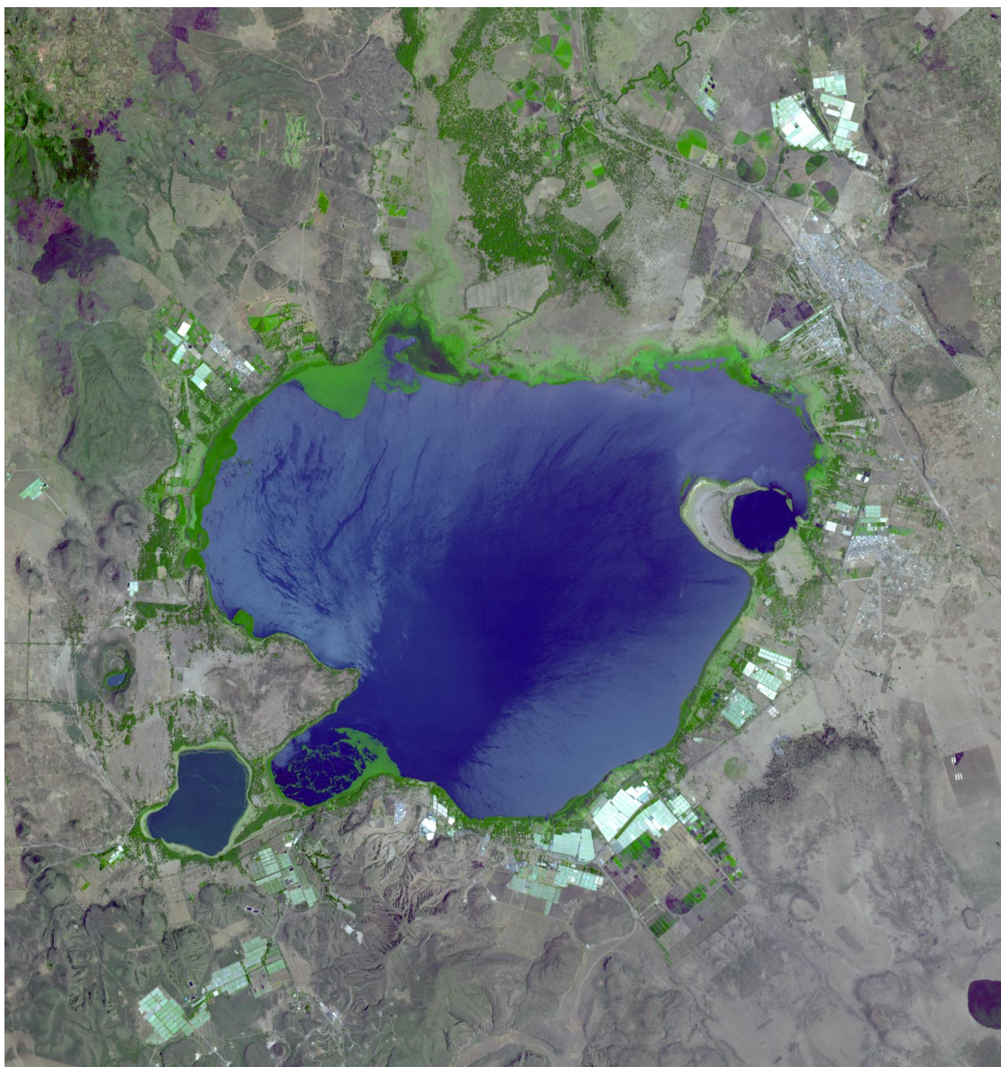
Lago Naivasha, no Quênia

E países da África estão usando seus patéticos recursos... a história que vem à mente é a do belo Lago Naivasha, no Quênia, que está morrendo porque fornece rosas à Europa.