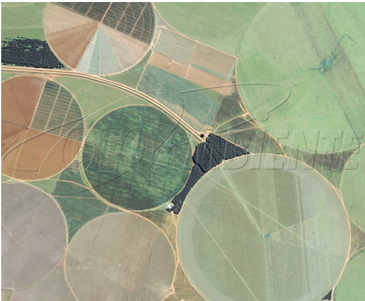
Irrigação por pivô central