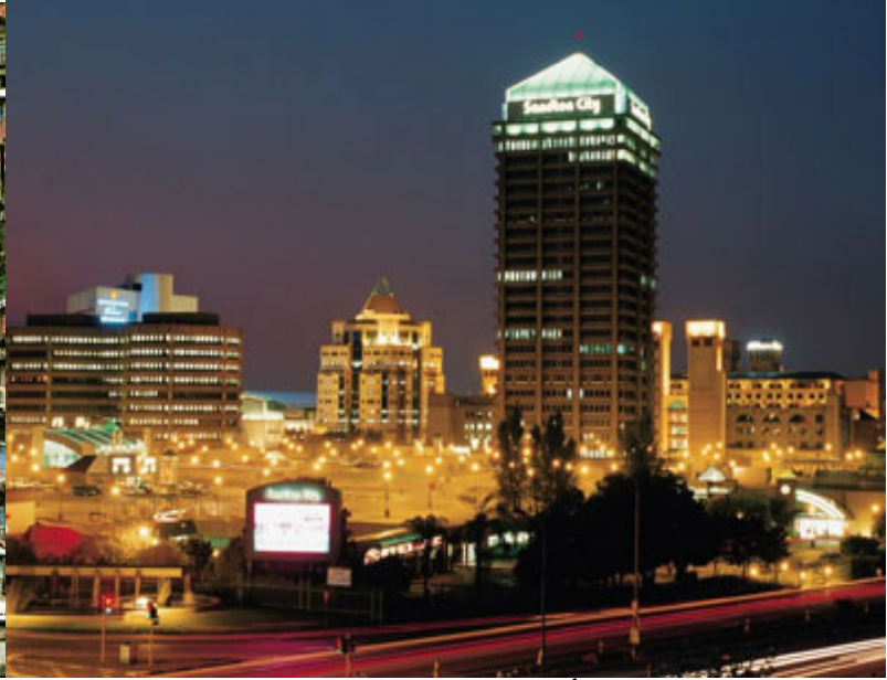
Sandton – Johannesburg - África do Sul

A água é o sinal mais visível da desigualdade no nosso mundo.