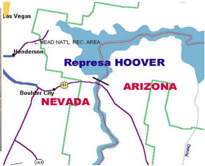
A linha em vermelho mostra o quanto o Lago Mead já recuou