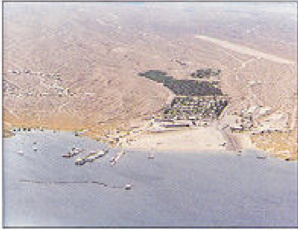
Temple Bar Marina